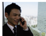
ワイドダイナミックレンジ オン時