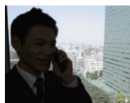
ワイドダイナミックレンジ オフ時

逆光等の照度差がある被写体でも明るさを補正し、より自然な映像を再現します。また、顔検出機能と連動することで、人物の顔が見えにくい場合に見やすく補正することが可能です。