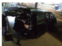
MOS センサー 搭載カメラによる映像