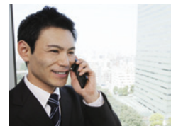
ワイドダイナミックレンジ オン + 顔連動制御時